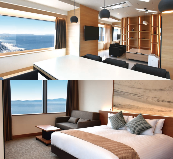
上: ODYSYS SUITES / 下: DELUXE CORNER DOUBLE BAYVIEW